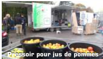
Pressoir pour jus de pommes