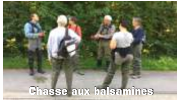
Chasse aux balsamines