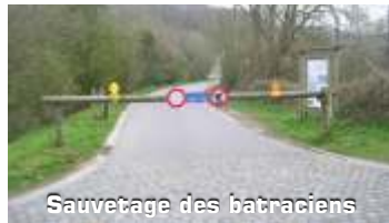
Sauvetage des batraciens